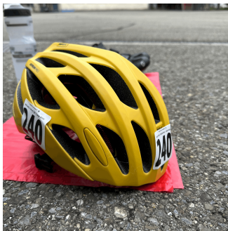
Fahrrad-Helm mit Startnummern