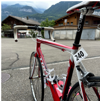
Rennvelo Kleber an Bremskabel

road bike equipment (bicycle helmet with start number sticker). Don't forget your start number!