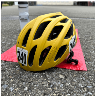
Fahrrad-Helm mit Startnummern