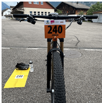
Mountain Bike mit Startnummer an Lenker

mountain bike with start number on handlebars