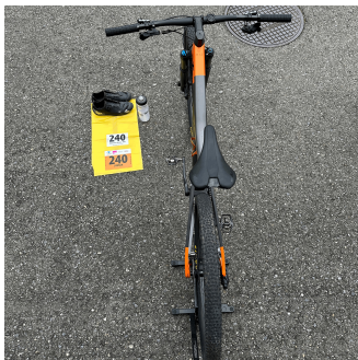
Ausrüstung Mountain Bike